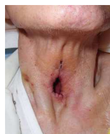
図4 手術後の気管孔を示します。気管カニュレの装着が不要な状態です。