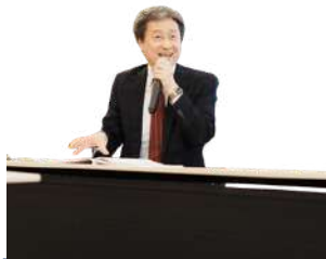
法人未来 プロジェクト

地域は、静かに、確実に変わり続けています。 その変化に、私たちは本気で向き合っているだろうか。