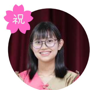
エイケイティさん きもべつ喜らめきの郷 3年目