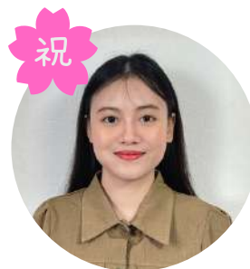
スモンタントさん きもべつ喜らめきの郷 5年目