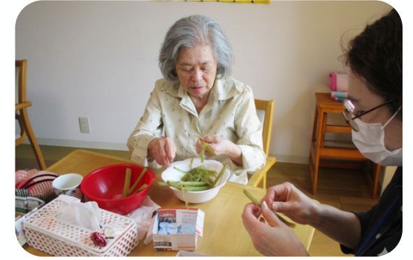
おしゃべりしながら蔬の皮むき

日々の小さな“なぜ？”に耳を澄ませ、考え続けること——それが、菊水こまちの郷の認知症ケアへの取り組み姿勢です。