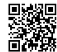
菊水こまちの郷（公式）