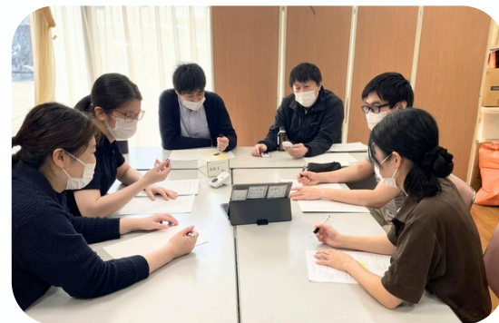
生産性向上委員会の様子

日々の業務の中で負担の軽減や安心感につながるなど、「使ってよかった」と感じられる経験を積み重ねていくことが、ICT活用を定着させる第一歩だと考えています。今後も、チームで話し合いながら、現場に合った形でICTの活用を進めていきます。