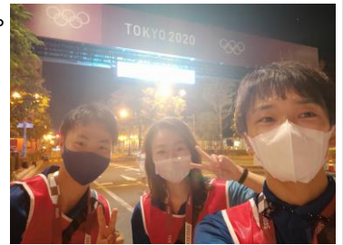
(大澤PT 岩崎PT 長井PT)

今大会は熱中症対策のアイパズを各Athlete Medical Stationに配置。国際大会では過去最多の配置数でPT、Nrs、DrとACA（Athlete Care Assistant）で共働しました。病院と同様、ここでもチームアプローチが重要でした！