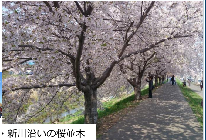
病院の桜・新川沿いの桜並木