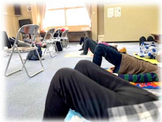
写真は、バックブリッジする様子