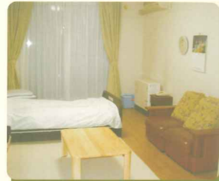
居室内部・トイレ・流し台