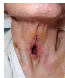
図4 手術後の気管孔を示します。気管カニューレの装着が不要な状態です。