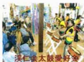
湊仁会太鼓愛好会