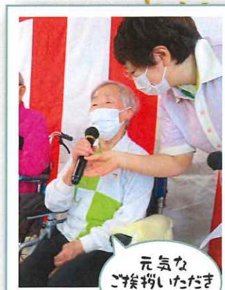
元気な ご挨拶いただきました!