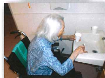
1日の終わりは念入りに磨きます♪