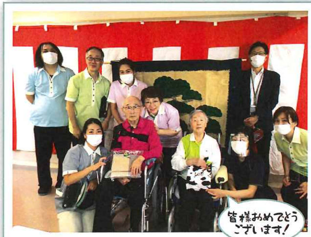
皆様おめでとう ございます!