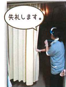
2時間毎に巡回します。

夜間帯は2時間毎に巡回し、状態の確認を行っています。その際に、掛物の調整や、褥瘡予防のため体位交換なども行います。