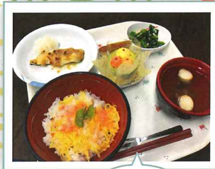
ケーキ付 お祝い膳♪