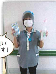
気持ちよくお休みいただけるように綺麗にします☆

お休み前に排泄を済ませます。お身体の状態に合わせ、トイレへご案内したり、ベッド上でパット交換を行います。また、夜間帯22時、3時で排泄ケアを行いますが、ご利用者様の状態に合わせて0時、1時、2時など追加でご案内しています。