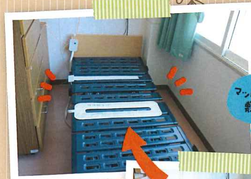
上の写真はaamsを敷いた状態、下の写真はその上にマットレスを乗せた状態です。