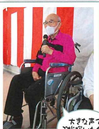
大きな声で ご挨拶いただきました!