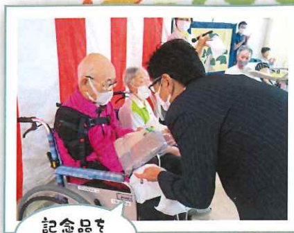
記念品を 贈呈しました!