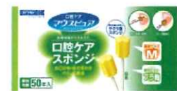
①川本産業 カワモト マウスピュア 口腔ケア スポンジ