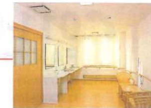
リラックススペース