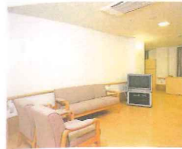
共同生活室（リビング）