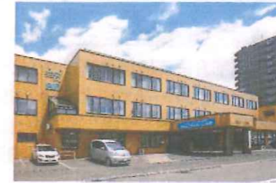
コミュニティホーム白石外観