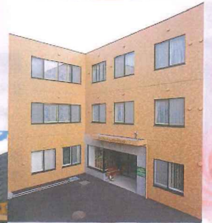
ショートステイセンター外観